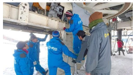
(第3クワッドリフト緊急時の訓練及び、予備原動機の稼働訓練)