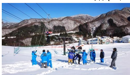
(オープン前の新人研修訓練)

当スキー場では、お客様を安全に輸送するために、シーズン営業開始前に、運転細則及び安全管理規程などで職員に教育を行っており、又、救助訓練については、オープン前と、シーズン中2回実施しました。