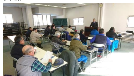
(シーズン前の従業員教育)