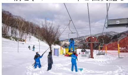
(従業員による救助訓練)