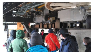
【予備原動機取扱訓練】