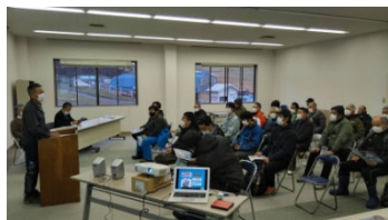
【シーズン前の従業員教育】